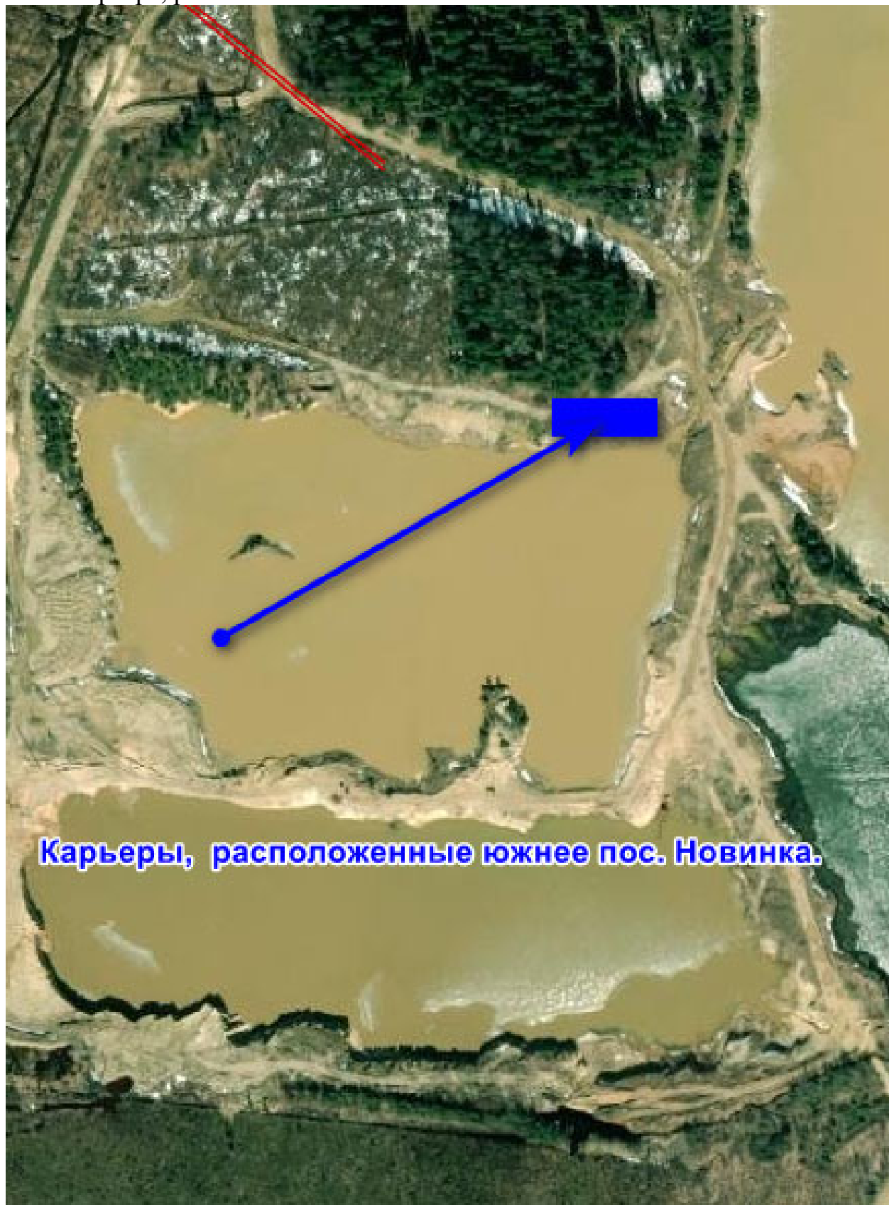
Карьеры, расположенные южнее пос. Новинка.

2.5. земельный участок с неразграниченной формой собственности возле карьера, расположенного южнее пос. Новинка.